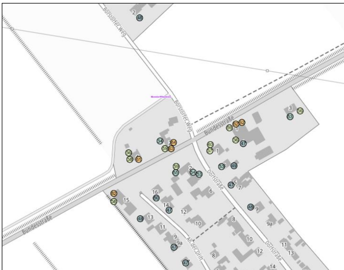
Abbildung 1: Fassadenpunkte L_{\text{Night}} B207 Niendorf a.d.St. (Ost)

Grundsätzlich stellen die ermittelten Lärmpegel entsprechend den Vorgaben für den Straßenverkehr A-bewertete äquivalente Dauerschallpegel (Mittelungspegel) dar. Der Mittelungspegel wird bei zeitlich schwankenden Geräusksituationen verwendet. Einzelereignisse wie z.B. einzelne laute Fahrzeuge können durchaus lautere Pegel erzeugen. Solche Einzelereignisse werden überproportional im Mittelungspegel berücksichtigt.