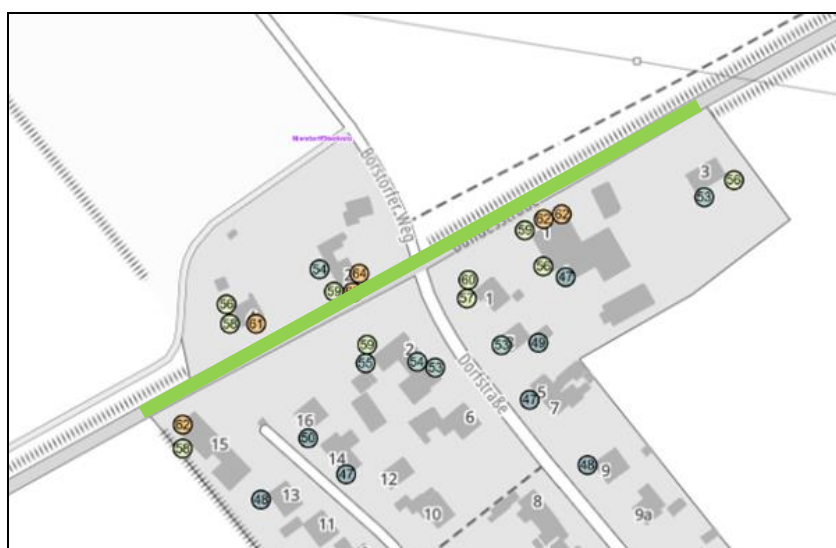
Abbildung 2: Tempo 50 Ortsdurchfahrt B207 Niendorf a.d.St.

Trotz eines potenziell eingebauten lärmarmen Asphalts verbleiben, vorbehaltlich einer Überprüfung nach RLS-90, Lärmbelastungen, die über den Lärmvorsorgewerten liegen. Daher sollte in der Ortsdurchfahrt auf der B207 Tempo 50 ganztags umgesetzt werden, um die sehr hohen Lärmbelastungen an den angrenzenden Wohngebäuden zu reduzieren.